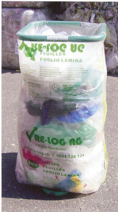
Das Poly-Sack-System der RE-LOG.

stoff ein zweites «Leben geschenkt» wird und somit die nicht unwesentliche Gewinnungs- und vor allem Herstellungsenergie nicht verloren geht.